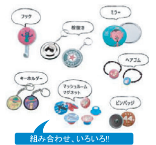
組み合わせ、いろいろ!!